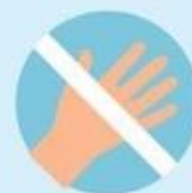
Не трогать глаза, рот и нос немытыми руками