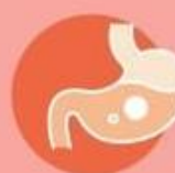
Проблемы с ЖКТ у детей