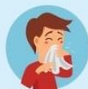
Близко не находиться с чихающими и кашляющими людьми