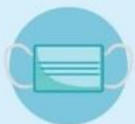
Носить маску и менять ее каждые 2 часа