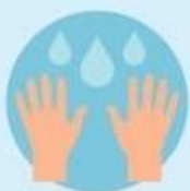
Мыть руки как минимум 20 секунд